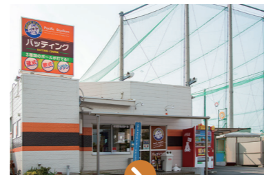
パシフィックスタジアム