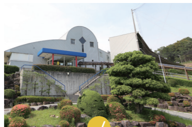
パシフィックゴルフセンター