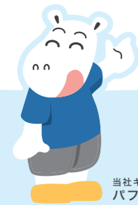
当社キャラクター パフィーくん