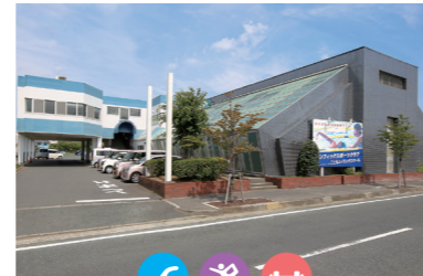
パシフィックスポーツ倶楽部 豊川