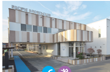
パシフィックスポーツ倶楽部 豊橋