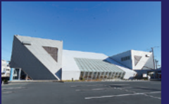
グランドパシフィックススポーツ倶楽部

パシフィックススポーツクラブ 検索 パシフィックススポーツクラブ(グランドパシフィックススポーツ倶楽部、パシフィックススポーツ倶楽部 豊川、パシフィックススポーツ倶楽部 豊橋、パシフィックテニス倶楽部、パシフィックゴルフセンター、パシフィックススタジアム)は、岡田建設株式会社グループです。