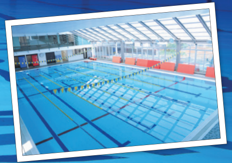
R3.8月パシフィック豊橋のプールにて撮影

プールの天井は高く、コース 数も6~7コースで広々。 UVカットフィルムガラスの屋 根で明るくとても開放的 です。スクール中のお子様 の様子を見守れる観覧席も完備。